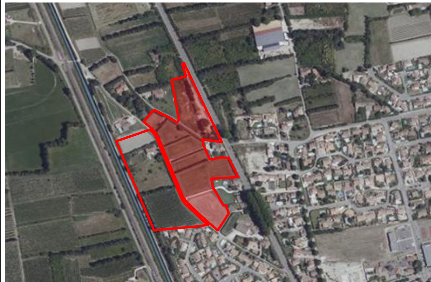
Vue Satellite au 1: 5 000

BOUYGUES-IMMOBILIER AGENCE PROVENCE Immeuble Grand Large 7, Boulevard de Dunkerque 13572 Marseille Cedex 02 Tél. : 04.96.11.78.00 SIRET 562 091 546 00605