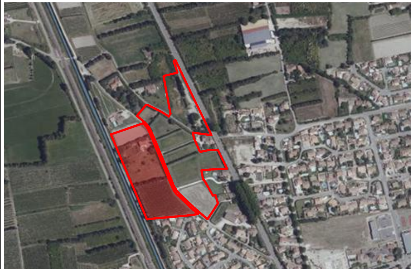
Vue Satellite au 1: 5 000

BOUYGUES-IMMOBILIER AGENCE PROVENCE Immeuble Grand Large 7, Boulevard de Dunkerque 13572 Marseille Cedex 02 Tél. : 04.96.11.78.00 SIRET 562 091 546 00605