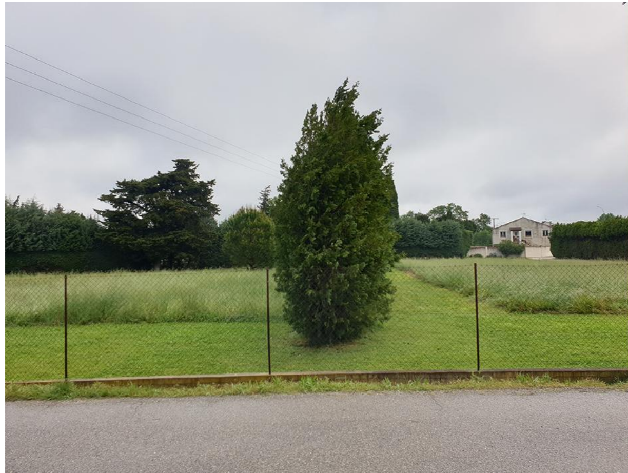
Vue 1 Du Nord du chemin de l'Auture vers l'Est