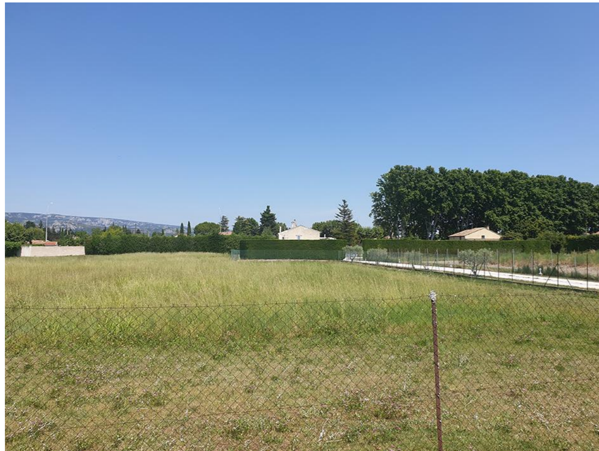
Vue 2 Du Sud du chemin de l'Auture vers l'Est

BOUYGUES IMMOBILIER AGENCE PROVENCE Immeuble Grand Large 7, Boulevard de Dunkerque 13572 Marseille Cedex 02 Tél. : 04.96.11.78.00 SIRET 562 091 546 00605