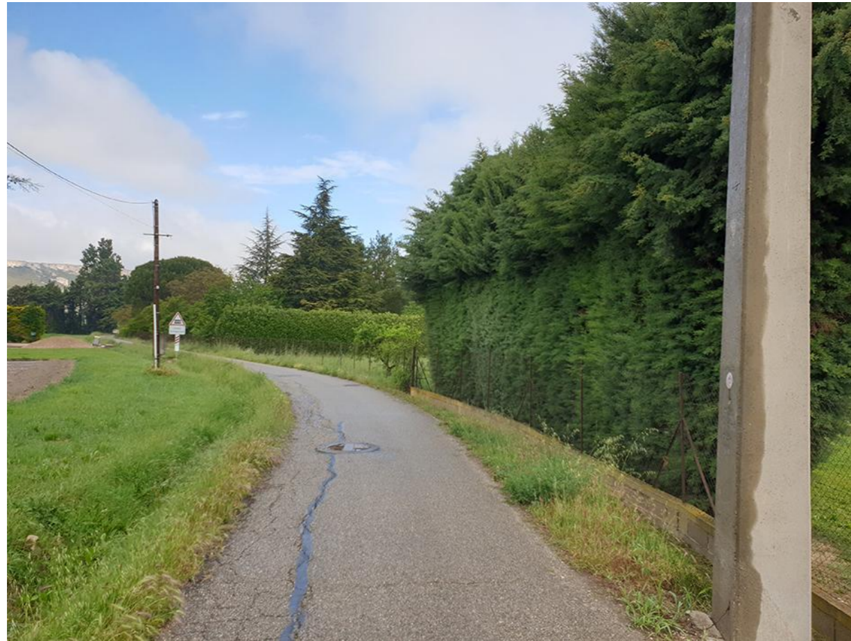
Vue 1 Du Nord du chemin de l'Auture vers le Nord