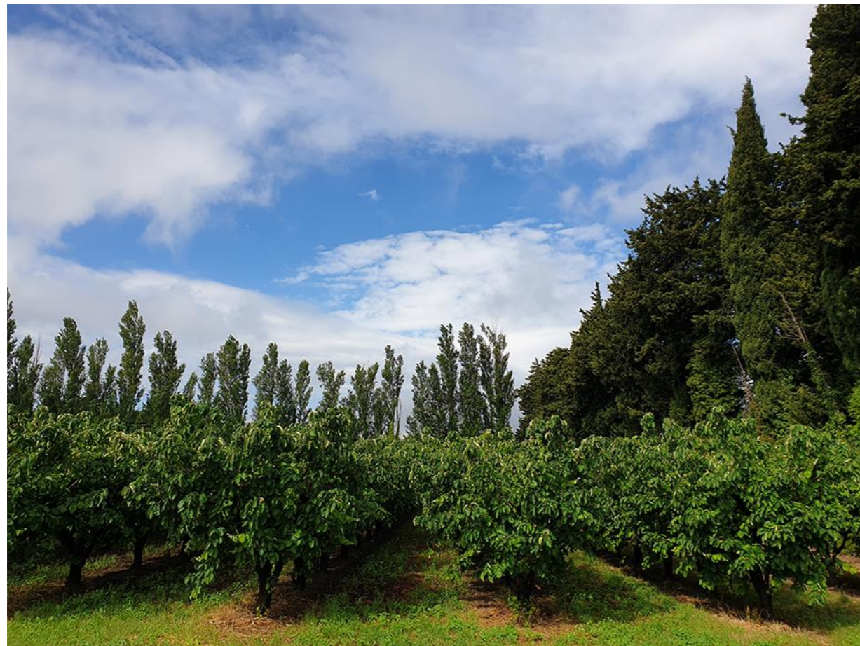
Vue 2 Du Sud du chemin de l'Auture vers l'Ouest

BOUYGUES-IMMOBILIER AGENCE PROVENCE Immeuble Grand Large 7, Boulevard de Dunkerque 13572 Marseille Cedex 02 Tél. : 04.96.11.78.00 SIRET 562 091 546 00605