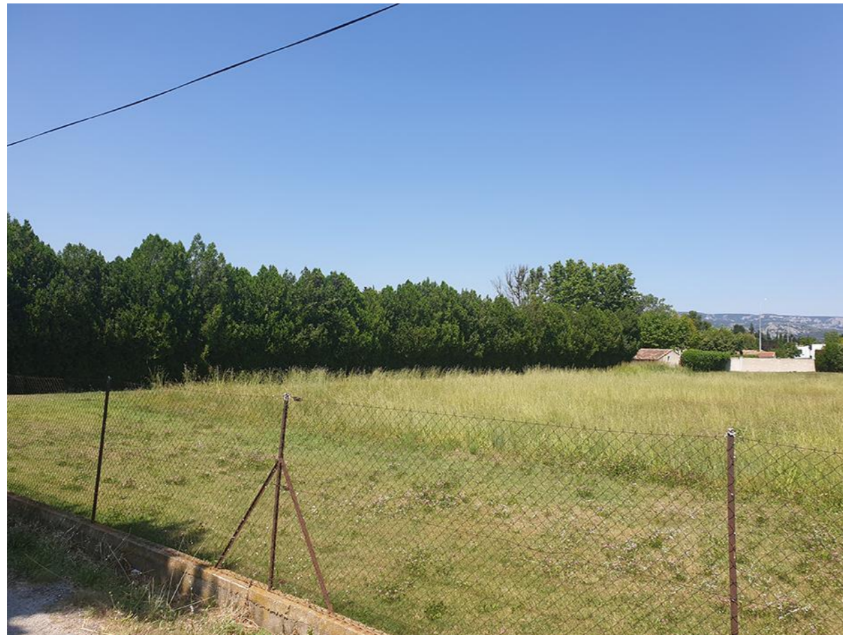
Vue 4 Du Sud du chemin de l'Auture vers le Nord

BOUYGUES IMMOBILIER AGENCE PROVENCE Immeuble Grand Large 7, Boulevard de Dunkerque 13572 Marseille Cedex 02 Tél. : 04.96.11.78.00 SIRET 562 091 546 00605