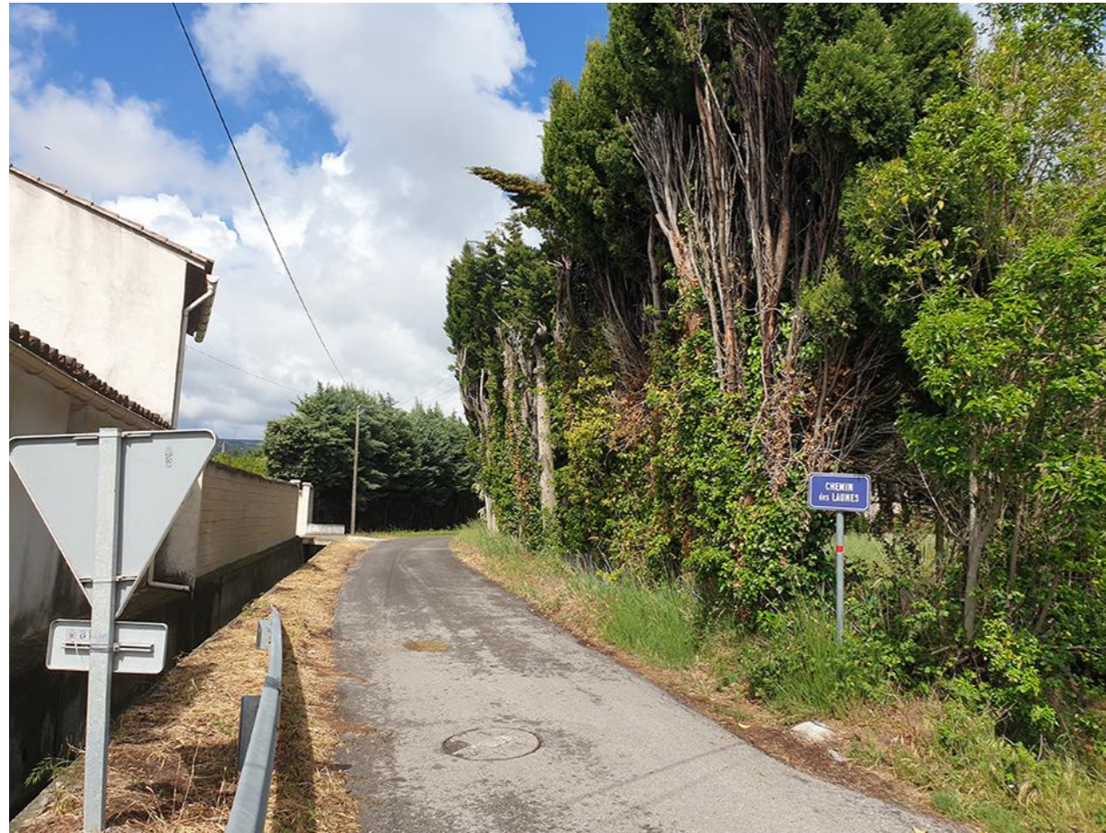
Vue 3 De l'Est du chemin des Launes vers l'Ouest