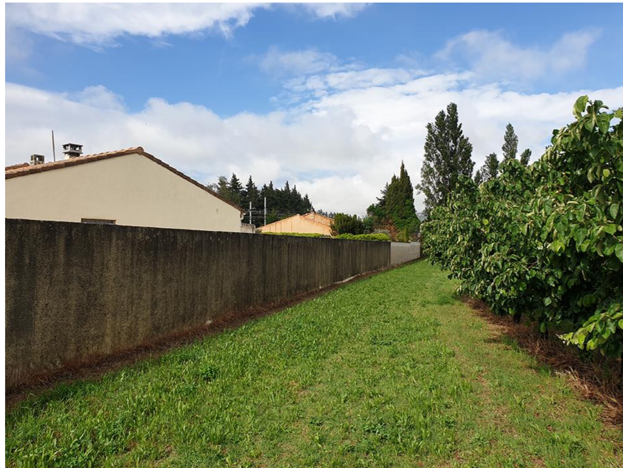
Vue 4 Du Sud du chemin de l'Auture vers l'Est

BOUYGUES-IMMOBILIER AGENCE PROVENCE Immeuble Grand Large 7, Boulevard de Dunkerque 13572 Marseille Cedex 02 Tél. : 04.96.11.78.00 SIRET 562 091 546 00605