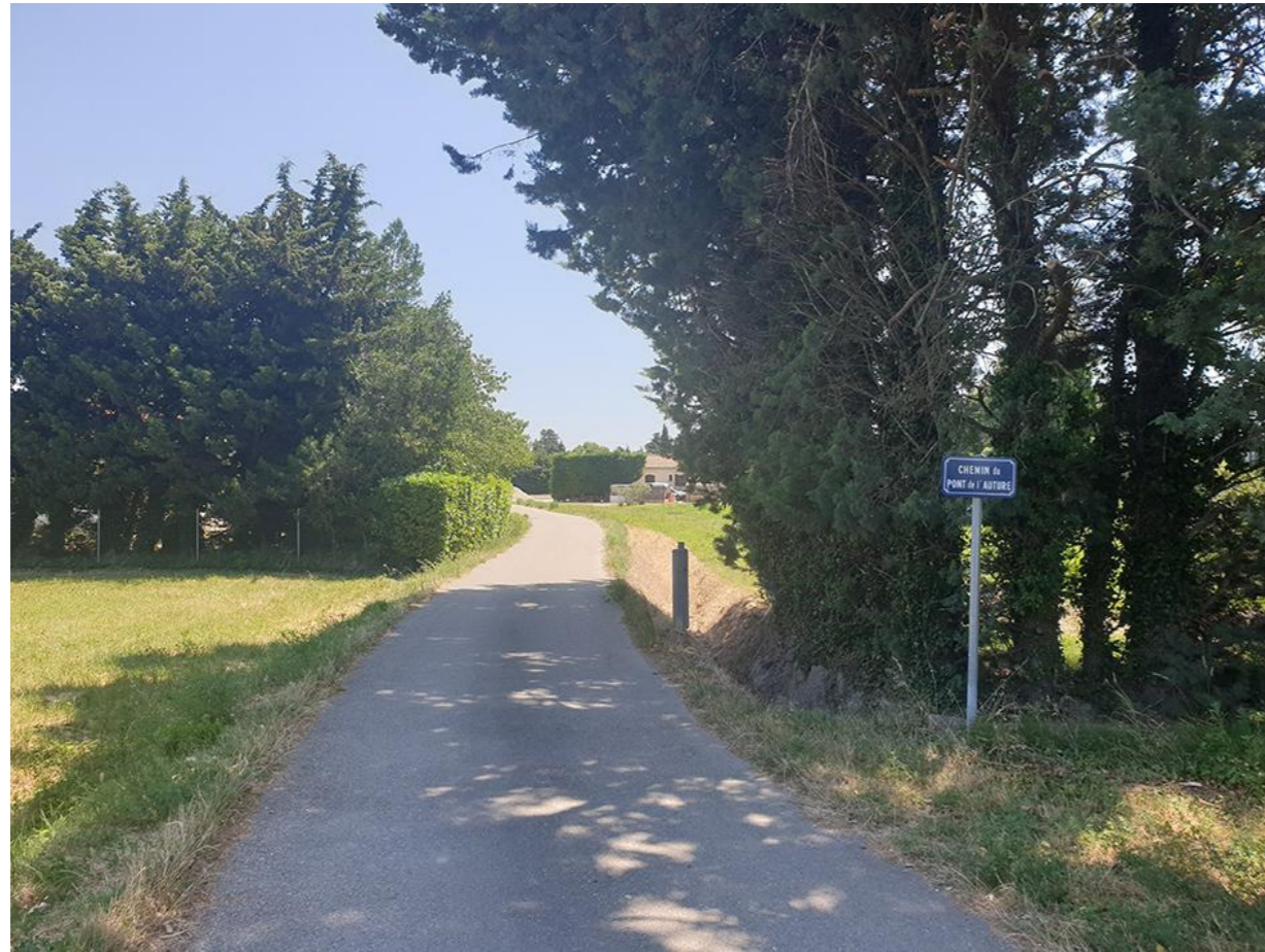
Vue 3 Du Nord du chemin de l'Auture vers le Sud